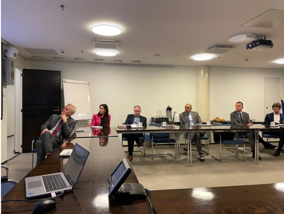
KUUMA-seudun kansanedustajista kokouksen avannut Anders Adlercreutz (vas.), KUUMA-seudun kansanedustajien varapuheenjohtaja Pihla Keto-Huovinen, Pekka Toveri, Ari Koponen, KUUMA-seudun kansanedustajien puheenjohtaja Eemeli Peltonen sekä Heikki Vestman. Kuvasta puuttuvat kansanedustajat Eerikki Viljanen ja Pinja Perholehto.