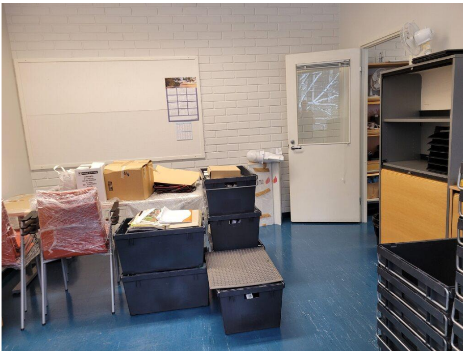
Muuttokuorma on saapunut uuteen toimistoon 24.2.2023

Henkilökunta on palvelusuhteessa Keravan kaupunkiin. KUUMA-seudun toimisto muutti Keravan kaupungintalolta 24.2.2023 uusiin tiloihin osoitteeseen Kauppakaari 4 (Kerava).