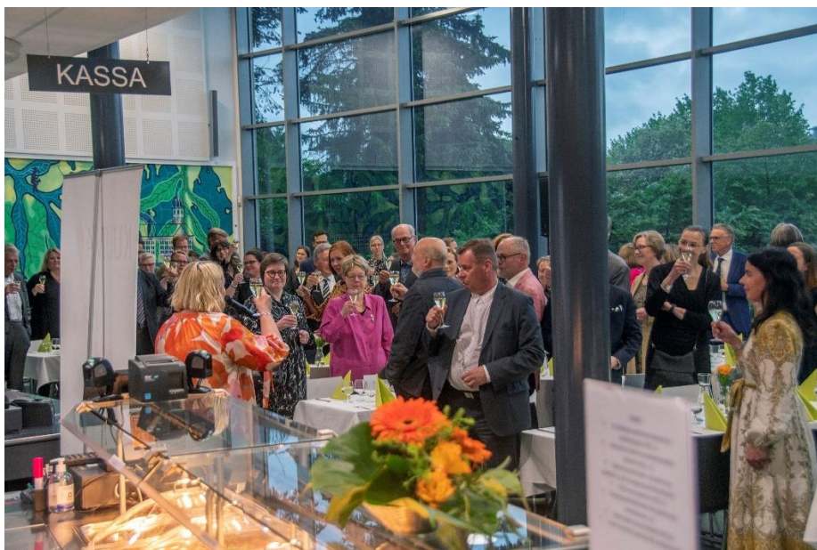
Maljan kohotus 20-vuotiselle KUUMA-yhteistyölle Keuda-talolla 2.6.2022.

KUUMA-kuntien luottamushenkilöiden ja viranhaltijoiden välinen yhteistyö ja vuorovaikutus on tiivistä. Monipuolisen yhteistyön keskeisenä tavoitteena seudun edunvalvonta-aseman sekä kuntien elinvoimaisuuden ja houkuttelevuuden vahvistaminen.