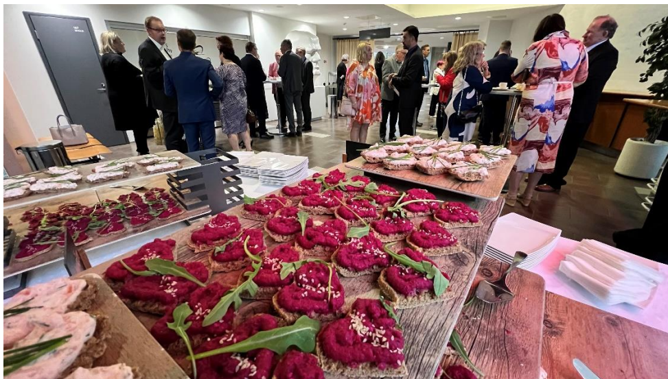
KUUMA-seudun yhteistyön 20-vuotisjuhlassa nautittiin herkullisia tarjoiluja.